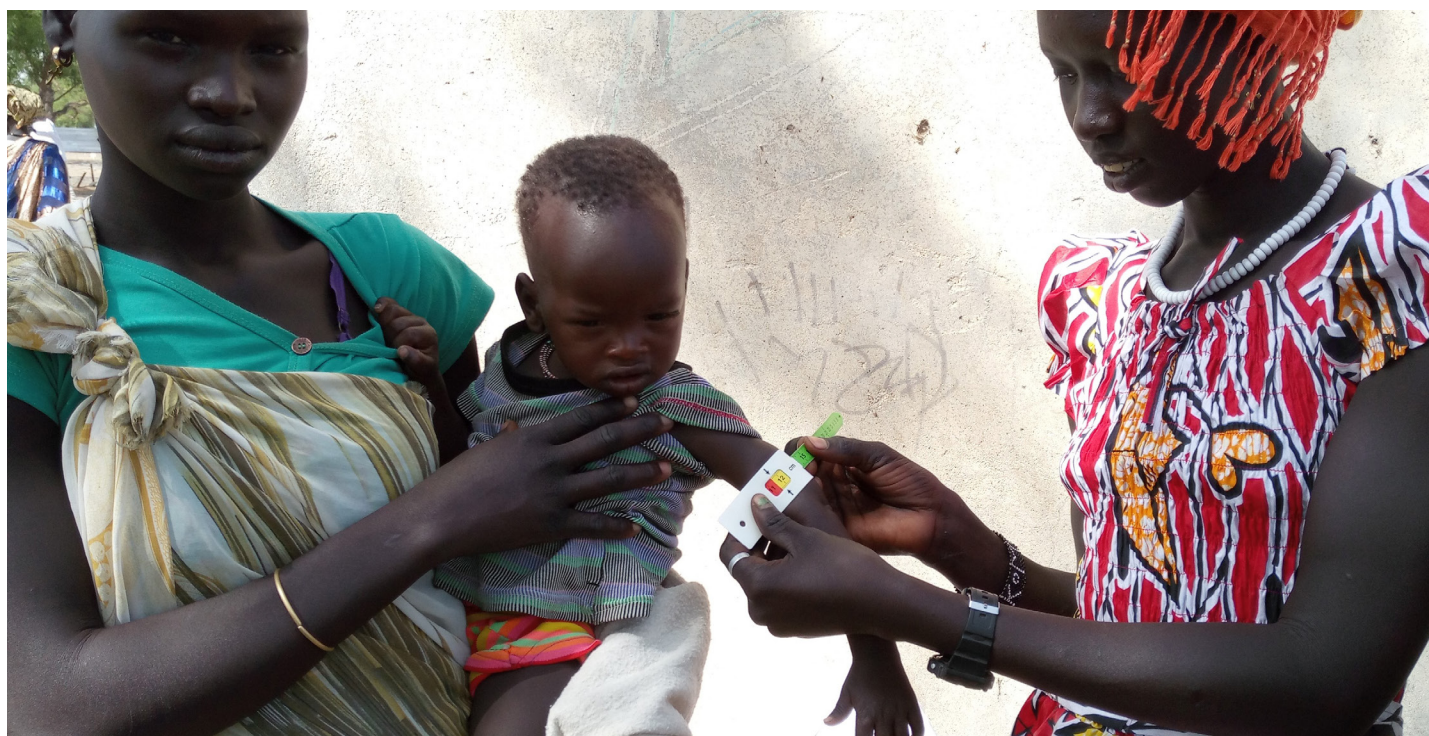
Comté d'Ulang au Sud-Soudan : Mères montrent leur compétence d'utiliser PB Mères