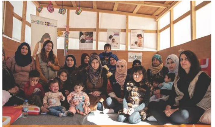
Arsal, Lübnan'da Bebek Dostu Mekan, 2020.