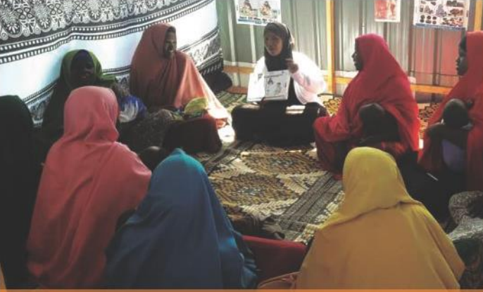
Anne Çocuk Alanı – Save the Children Somali