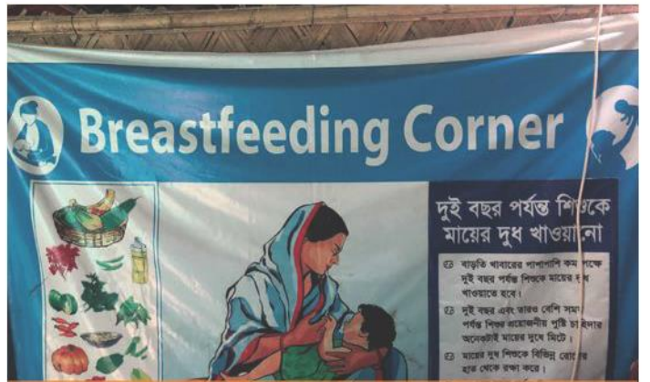
Emzirme destek köşesindeki önemli mesajlar, Cox's Bazar.