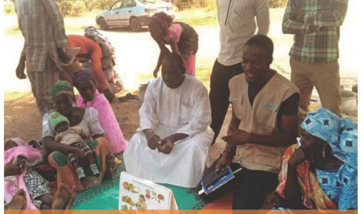
Topluluktaki IYCF-E faaliyetleri, Kuzey Nijerya, Mayıs 2020.