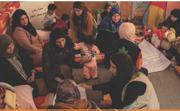
Arsal, Lübnan'da Bebek Dostu Mekan, 2020.