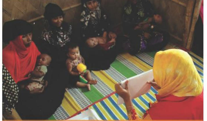
Rohingya Müdahalesi sırasında Cox's Bazaar'daki Anne Bebek Alanında grup eğitimi. Save the Children Bangladeş