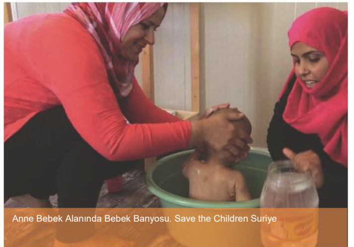
Anne Bebek Alanında Bebek Banyosu. Save the Children Suriye