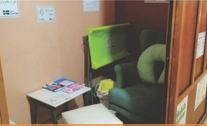
Kamad llaws, Lübnan'da kalabalık bir sağlık tesisinde IYCF Köşesi, 2020.