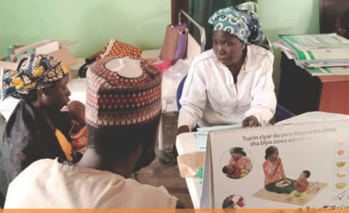
IYCF köşesi, Kuzey Nijerya, Mayıs 2020. UNICEF