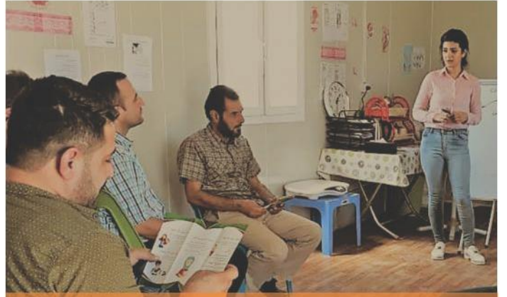
Suriye'de babalar grubu. Save the Children