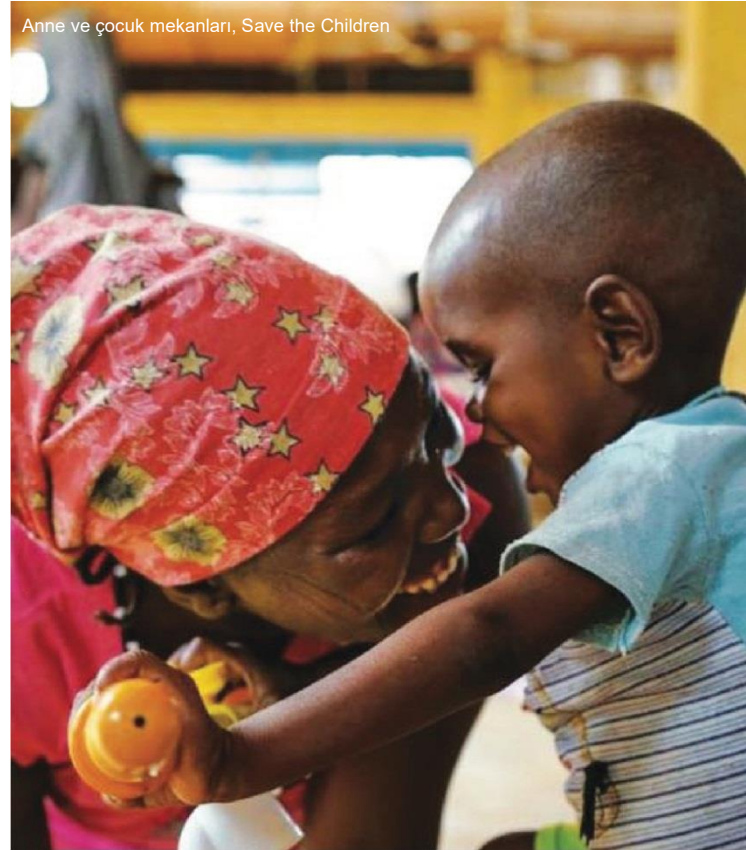
Anne ve çocuk mekanları, Save the Children

Kapasite sınırlı ise son çare olarak hedefleme kriterleri ayarlanabilir (ör. IYCF veya MHPSS zorlukları yaşayan bakıcılar ile sınırlandırmak).