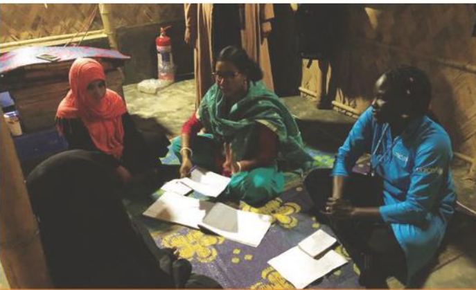
Emzirme destek köşesi, Cox's Bazar. UNICEF