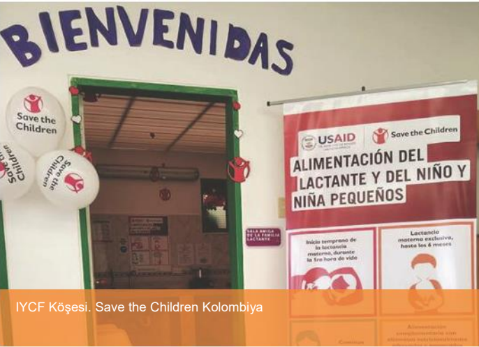
IYCF Köşesi. Save the Children Kolombiya