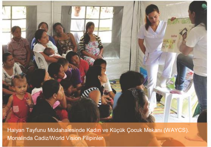
Haiyan Tayfunu Müdahalesinde Kadın ve Küçük Çocuk Mekanı (WAYCS).