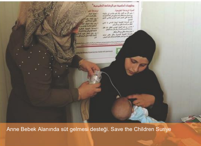
Anne Bebek Alanında süt gelmesi desteği. Save the Children Suriye