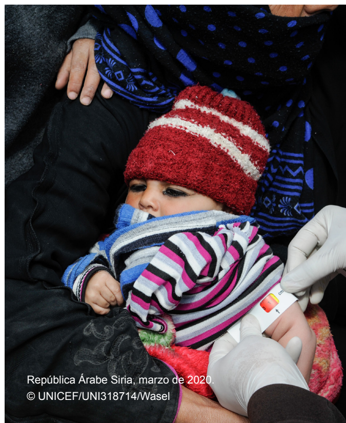
República Árabe Siria, marzo de 2020.

Para responder a la pregunta de quién debe recibir transferencias monetarias —por medios físicos o electrónicos—, es importante tener en cuenta que la asistencia para lograr resultados nutricionales a menudo se dirige hacia los individuos (principalmente niños), pero que la asistencia se entrega a un familiar adulto. En principio, las transferencias monetarias individuales se deben entregar a la persona en cuestión o, en el caso de niños, a la persona encargada de su cuidado. En cuanto a las transferencias monetarias a las familias, en general las pruebas indican que entregar efectivo a las mujeres, en lugar de a los hombres, a menudo propicia una mayor mejora en el bienestar de los niños, ya que aumenta el control de los recursos del hogar por parte de las mujeres y, en consecuencia, el gasto que redundará en la salud, la nutrición y la educación de los niños (Fenn, 2015). La decisión de qué familiar recibe las transferencias monetarias se debe basar en un análisis de género 40 y requiere, además, la aceptación de la comunidad afectada. Las transferencias monetarias a los hogares que no tienen en cuenta las dinámicas familiares y pasan por alto la aceptación de la comunidad corren el riesgo de provocar consecuencias imprevistas y ser perjudiciales.