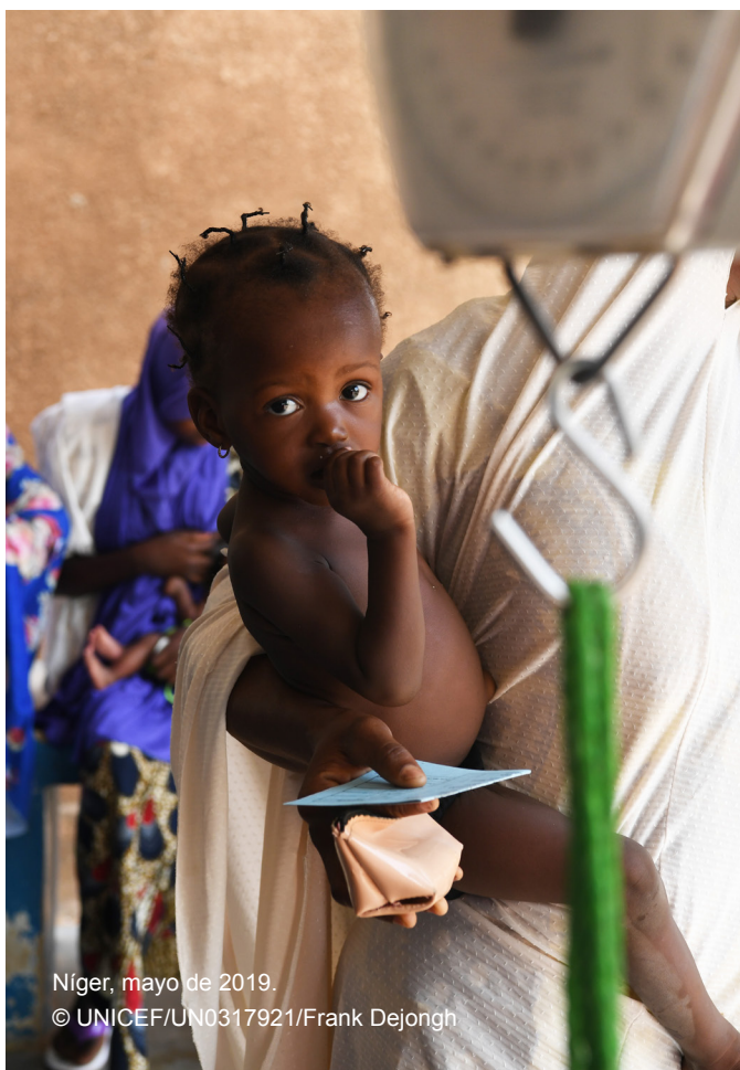
Níger, mayo de 2019.

La mayoría de las transferencias humanitarias en efectivo que se realizan a nivel de las familias se ejecutan en el sector de la seguridad alimentaria o como transferencias monetarias multipropósito. El empleo de las transferencias monetarias multipropósito ha aumentado rápidamente en la respuesta humanitaria durante los últimos años y actualmente son una forma habitual de asistencia en efectivo para las familias. Por lo general, no están diseñadas para contribuir a los resultados nutricionales, y su impacto en la nutrición materno-infantil apenas está documentado. No obstante, pueden ser una modalidad de respuesta atractiva desde una perspectiva nutricional, ya que el monto de la transferencia proporcionado tiene el potencial de corregir transversalmente los obstáculos económicos de los factores subyacentes. No se debe esperar que las transferencias en efectivo a familias por sí solas, incluidas las transferencias monetarias multipropósito, contribuyan a los resultados nutricionales de los distintos miembros del hogar. Sin embargo, se pueden adoptar diferentes medidas para aumentar la probabilidad de que lo hagan. Estas medidas incluyen: