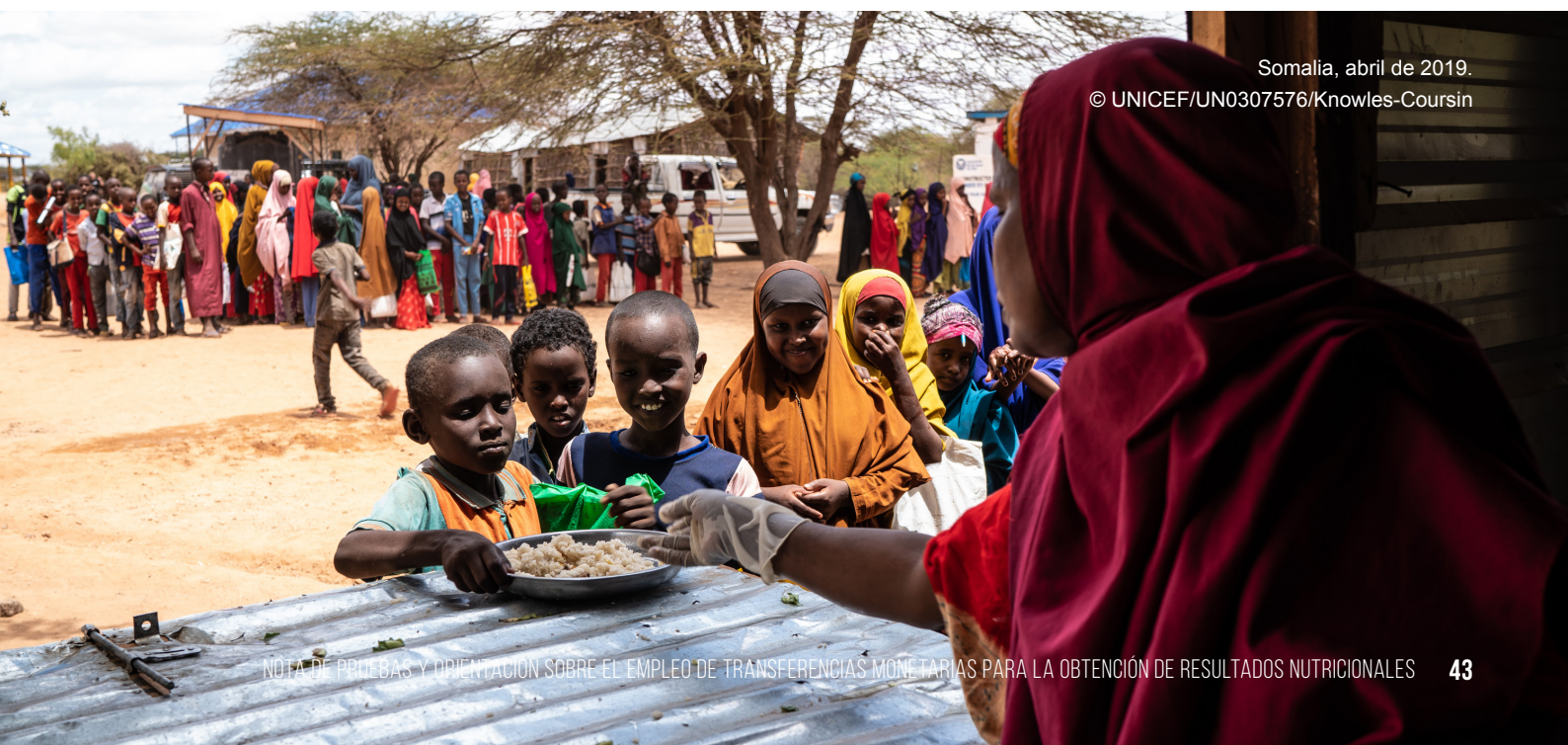
Somalia, abril de 2019.