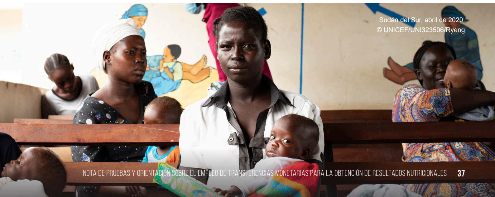
Sudán del Sur, abril de 2020.