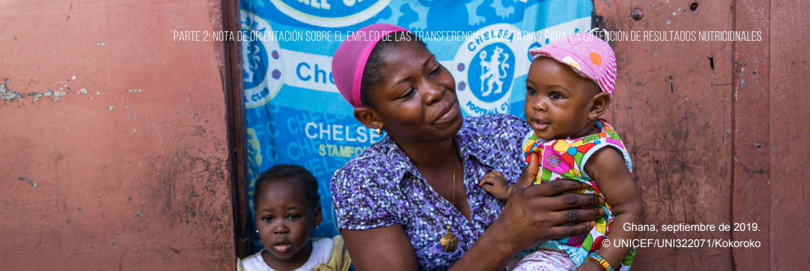
Ghana, septiembre de 2019.