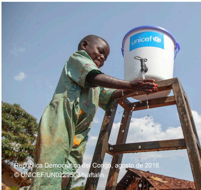
República Democrática del Congo, agosto de 2018.