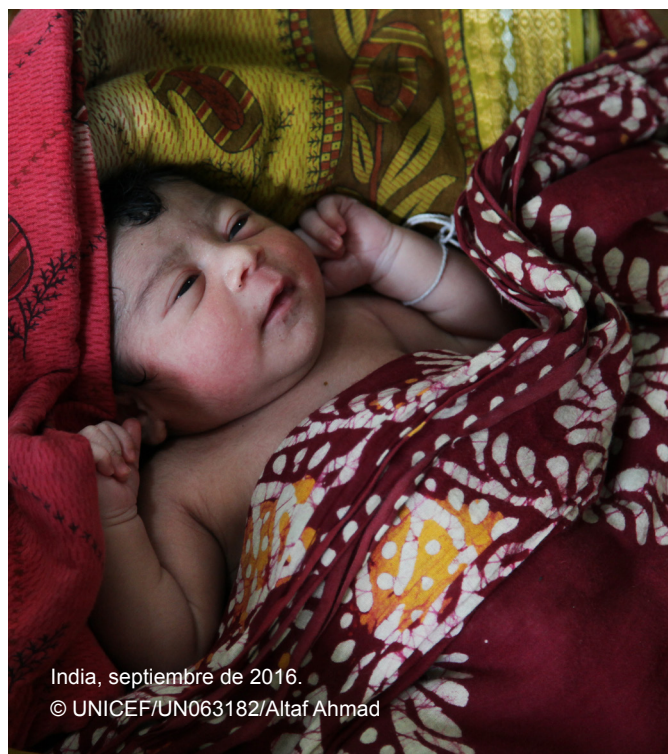
India, septiembre de 2016.

En Bangladesh, de 2015 a 2016, World Vision International (2019) ofreció transferencias en efectivo condicionadas mensuales de 2.200 takas (unos 27,50 dólares) a mujeres embarazadas y lactantes que vivían por debajo del umbral de pobreza inferior durante 15 meses mientras estaban embarazadas y después del nacimiento del niño. Esta ayuda estaba condicionada a la realización de tres reconocimientos médicos prenatales durante el embarazo, un reconocimiento médico posnatal, sesiones mensuales de promoción y seguimiento del crecimiento, y la asistencia a sesiones orientadas al cambio social y de conducta después del parto. Las mujeres comunicaron que no les parecía difícil cumplir las condiciones para recibir la asistencia en efectivo. Es más, el proyecto aplicó una cierta flexibilidad en relación con la condicionalidad: si una madre no asistía a una sesión sin tener un motivo de gravedad, no recibiría la contribución ese mes, pero seguía teniendo derecho a recibir la totalidad de los 15 pagos si asistía a sesiones posteriores. El programa permitió aumentar la asistencia de las mujeres a los centros de salud; mejoró asimismo los resultados de salud de los niños y las madres, e incrementó la diversidad, calidad y cantidad de las dietas.