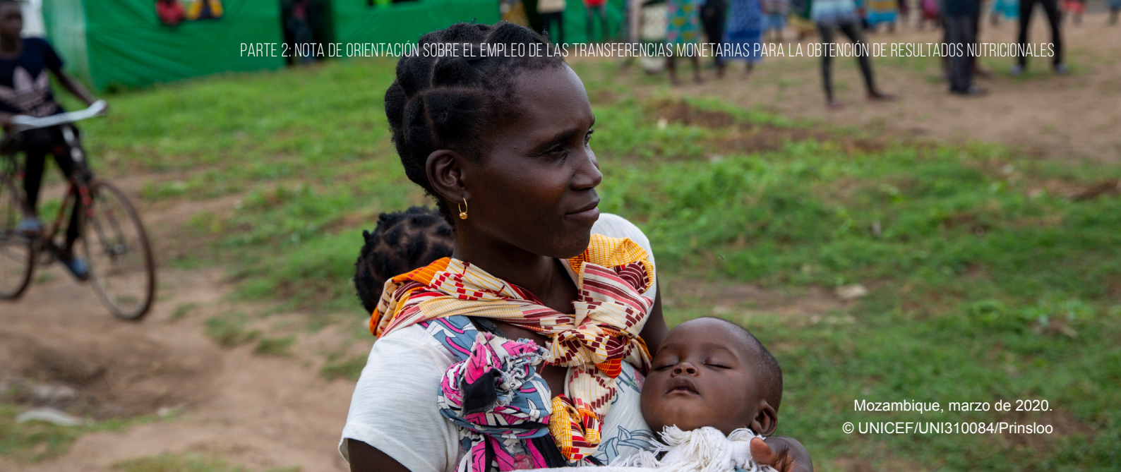
Mozambique, marzo de 2020.