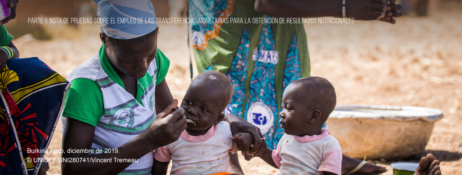
Burkina Faso, diciembre de 2019.