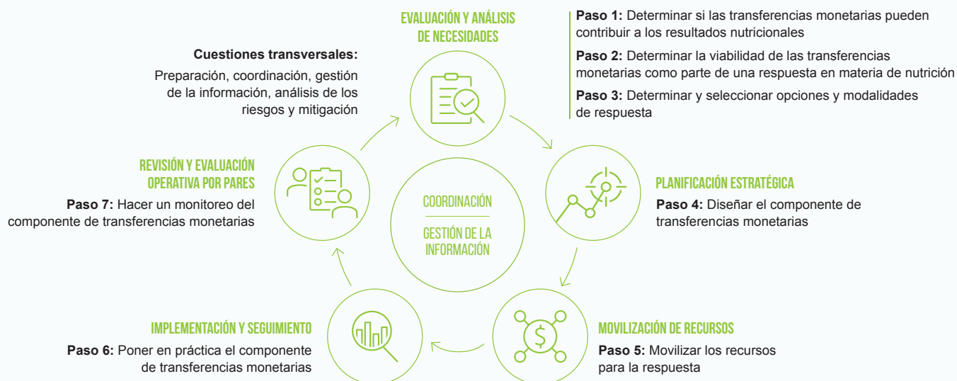
Figura 2. Pasos y cuestiones transversales a lo largo del ciclo de programación humanitaria

En la figura 2 se resumen los elementos principales del ciclo de programación humanitaria. Este ciclo incorpora los siete pasos imprescindibles para examinar y utilizar las transferencias monetarias en una respuesta en materia de nutrición, además de cuestiones transversales que se deben tener en cuenta durante la respuesta, como, por ejemplo, la preparación, la coordinación, la gestión de la información, y los riesgos.