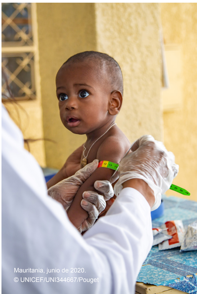
Mauritania, junio de 2020.