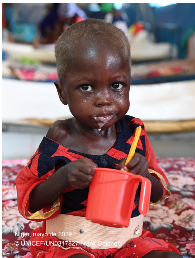
Níger, mayo de 2019.

La duración y el momento de la asistencia para prevenir la malnutrición aguda, independientemente de la modalidad, deben basarse en la escala y gravedad de la emergencia, la prevalencia de la malnutrición aguda global y otros factores, como la seguridad alimentaria, la estacionalidad de la misma y los patrones epidémicos de las enfermedades infecciosas (Grupo Temático Mundial sobre Nutrición, 2017). Durante dicho período, se puede facilitar una transferencia monetaria individual o a los hogares dirigida a obtener resultados nutricionales con vistas a proporcionar una red de seguridad durante los primeros 1.000 días. Independientemente del objetivo específico, la transferencia monetaria individual o para los hogares no se debe proporcionar por menos de tres meses. Es poco probable que plazos demasiado cortos tengan impacto alguno en los resultados nutricionales. En cuanto a la frecuencia de las transferencias monetarias, se recomienda realizar transferencias regulares (por ejemplo, mensuales) si el objetivo de estas es proporcionar una dieta variada y nutritiva.