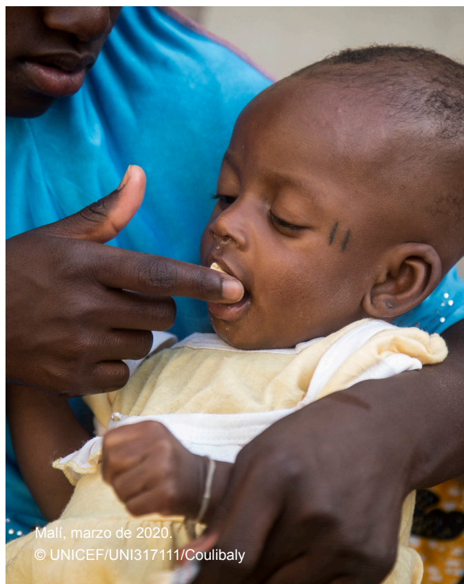
Malí, marzo de 2020.

A su vez, en los campamentos de desplazados internos de los alrededores de Mogadiscio (Somalia), la UCL y Concern (2020) compararon los efectos de las transferencias en efectivo condicionadas e incondicionales en la utilización de los servicios de salud y la cobertura de vacunación en los campamentos de desplazados internos. Ambos grupos del estudio recibieron transferencias monetarias mensuales de 70 dólares en los primeros 3 meses y de 35 dólares durante otros 6 meses. En el grupo condicionado, las personas cuidadoras debían llevar a los niños menores de cinco años a una clínica local para que se les hiciese una revisión médica y se les entregara una tarjeta de registro sanitario. La condicionalidad se asoció con un aumento decidido y significativo de la cobertura de la vacunación y una reducción de la infección de sarampión.