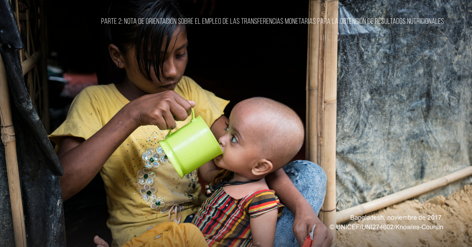
Bangladesh, noviembre de 2017.