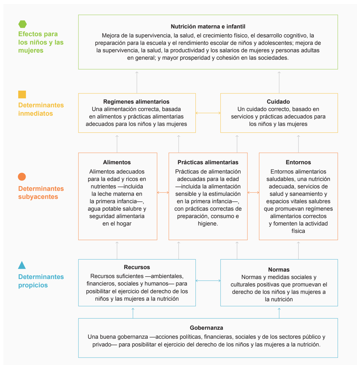
Figura 1. Marco conceptual actualizado de UNICEF sobre los determinantes de la nutrición materno-infantil (UNICEF, 2019)