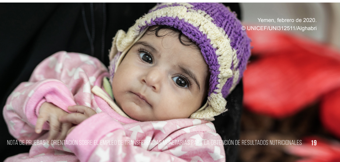
Yemen, febrero de 2020.

En lo que respecta a la frecuencia de las transferencias, una serie de pruebas procedentes de contextos de desarrollo sugieren que los pagos regulares (p. ej., mensuales) tienen mayor repercusión a corto plazo en los resultados nutricionales y las causas subyacentes de la desnutrición, como el gasto en alimentos, mientras que es más probable que las transferencias menos frecuentes y de sumas fijas se inviertan en actividades productivas, como la producción agrícola (Fenn, 2015). Ecker et al. (2019) evalúan el efecto mitigador del programa nacional de transferencias en efectivo del Fondo de Bienestar Social en la malnutrición infantil en el Yemen. Se descubrió que el efecto de mitigación solía ser mayor cuanto más pagos regulares se recibían, ya que la asistencia habitual permite a los hogares beneficiarios gestionar su consumo de alimentos y otras demandas que influyen en los resultados nutricionales de los niños.