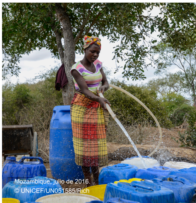
Mozambique, julio de 2016.