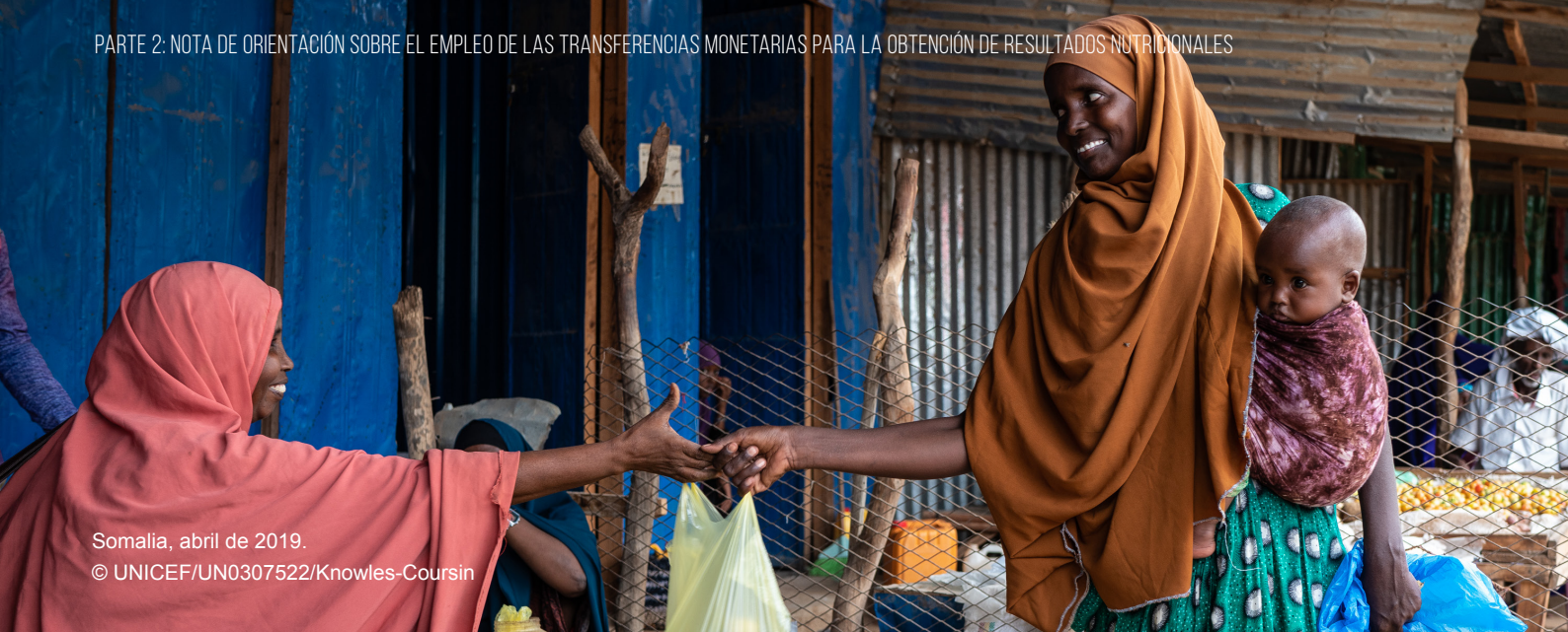
Somalia, abril de 2019.