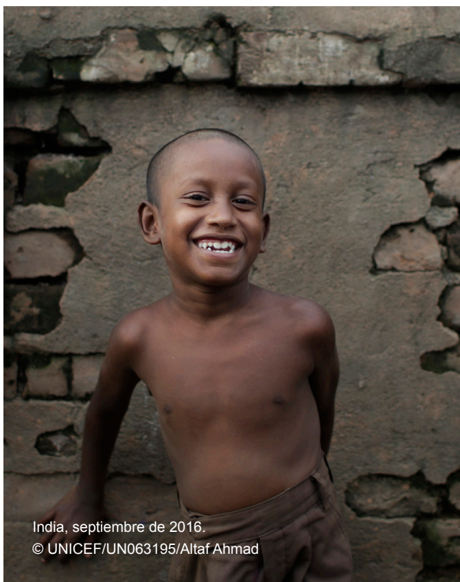
India, septiembre de 2016.