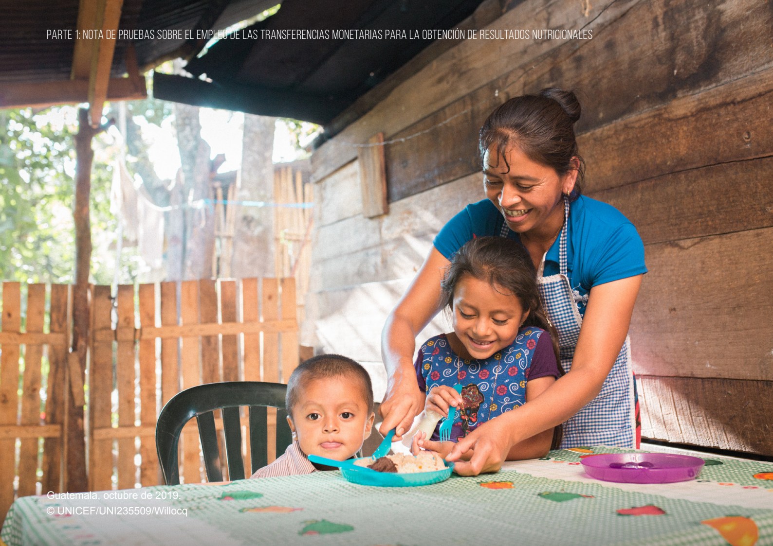
Guatemala, octubre de 2019.